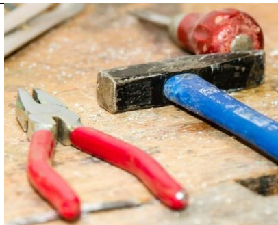
Techniek werkplaats (bijv. zoals Schönste wijk i.s.m. Ontdekstation)