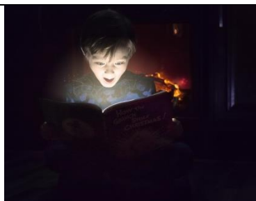
Leesclub: lezen en praten over boeken