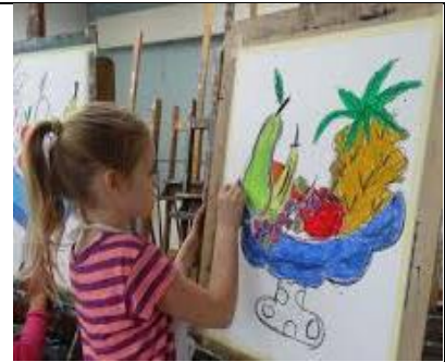
Schilderen of tekenen