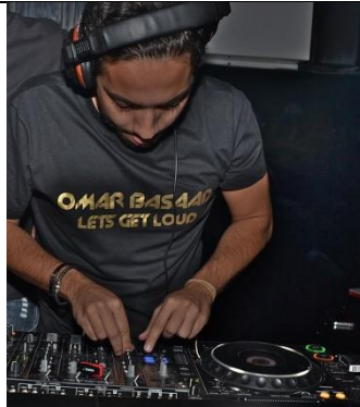
DJ of digitale media