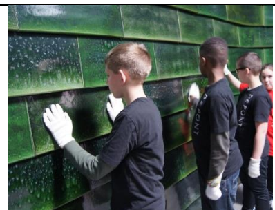
Museumclub / Anders kijken