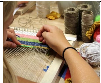
Textiel (weven, naaien, borduren, breien, enz.)