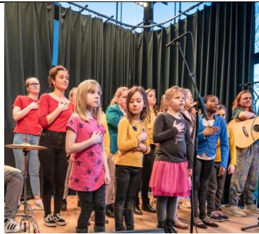
Zingen in een koor