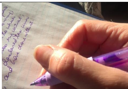
Schrijfclub creatief en/of kinderpersbureau